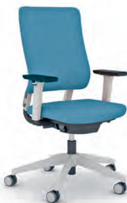
Task chair Bureaustoel

Het Drumback programma omvat professionele zitoplossingen voor diverse toepassingen. Naast de bureaustoel voor de standaard werkplek biedt de Drumback-serie ook speciale oplossingen in dezelfde look, zoals verhoogde counterstoelen, die formeel gebaseerd zijn op de kantoor- of conferentiestoel, en een NPR-variant, die dankzij een groter verstelbereik geschikt is voor een grotere groep binnen de beroepsbevolking en bijzonder geschikt is voor flexwerkplekken en bijvoorbeeld call-center werkplekken.