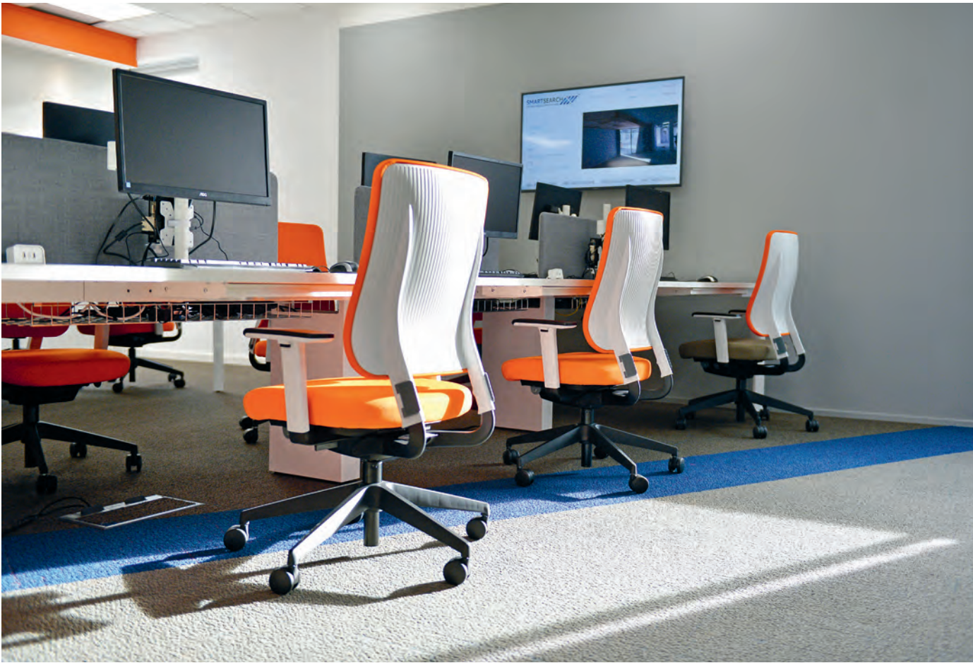
Smartsearch, Ilkley (GB/UK)