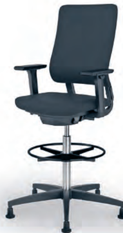
Counter chair Counter-bureaustoel