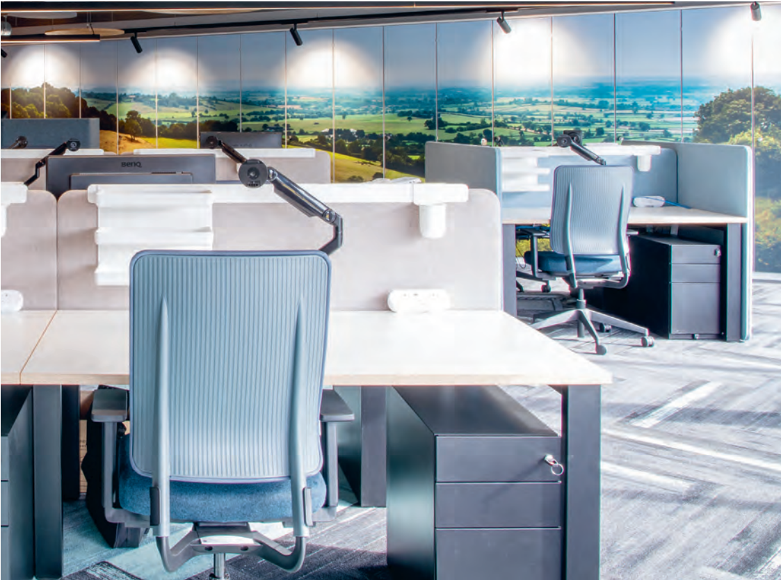
Wyke Farms, Bruton (GB/UK)