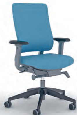
NPR task chair NPR-Bureaustoel