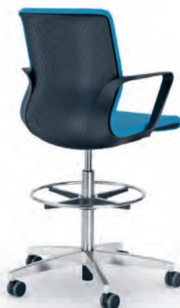
Collaborative counter chair Counter-vergaderstoel