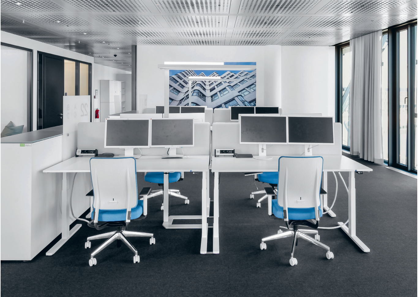
Cube, Deutsche Bahn Berlin Duitse spoorwegen Berlijn